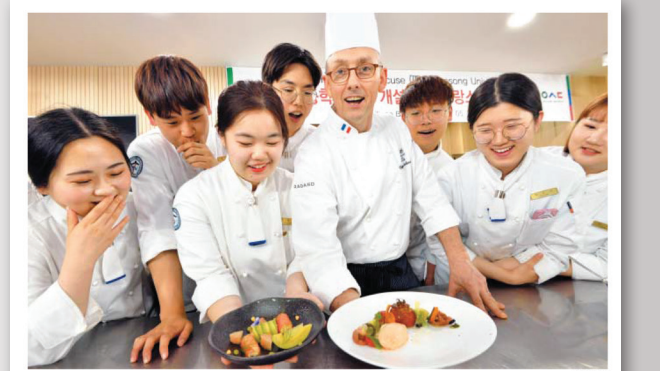
신원기 세계 최정상급 조리학교인 프랑스 폴 보퀴즈의 필립 바르망 교수가 지난 16일 대전 우송대에서 외식조리분야 재학생들에게 프랑스 요리 조리법을 소개하고 있다.